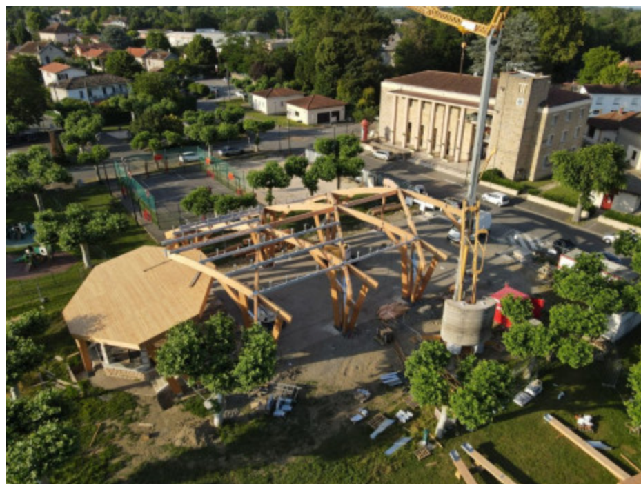
L'assemblage de la halle a été réalisée par la société Antras en groupement avec Comminges Bâtiment, et a mobilisé jusqu'à 10 salariés sur près de deux mois de chantier.

public l'impression d'évoluer sous les arbres. Mais il présentait aussi des avantages en termes de délais : deux mois de travail, ce qui a suffi pour édifier la halle, et seul le bois pouvait permettre une mise en œuvre aussi rapide", insiste l'architecte.