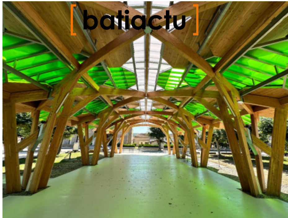
Livrée début août, la nouvelle halle de Boussens (Haute-Garonne) met en oeuvre près de 80 m 3 de bois lamellé-collé.